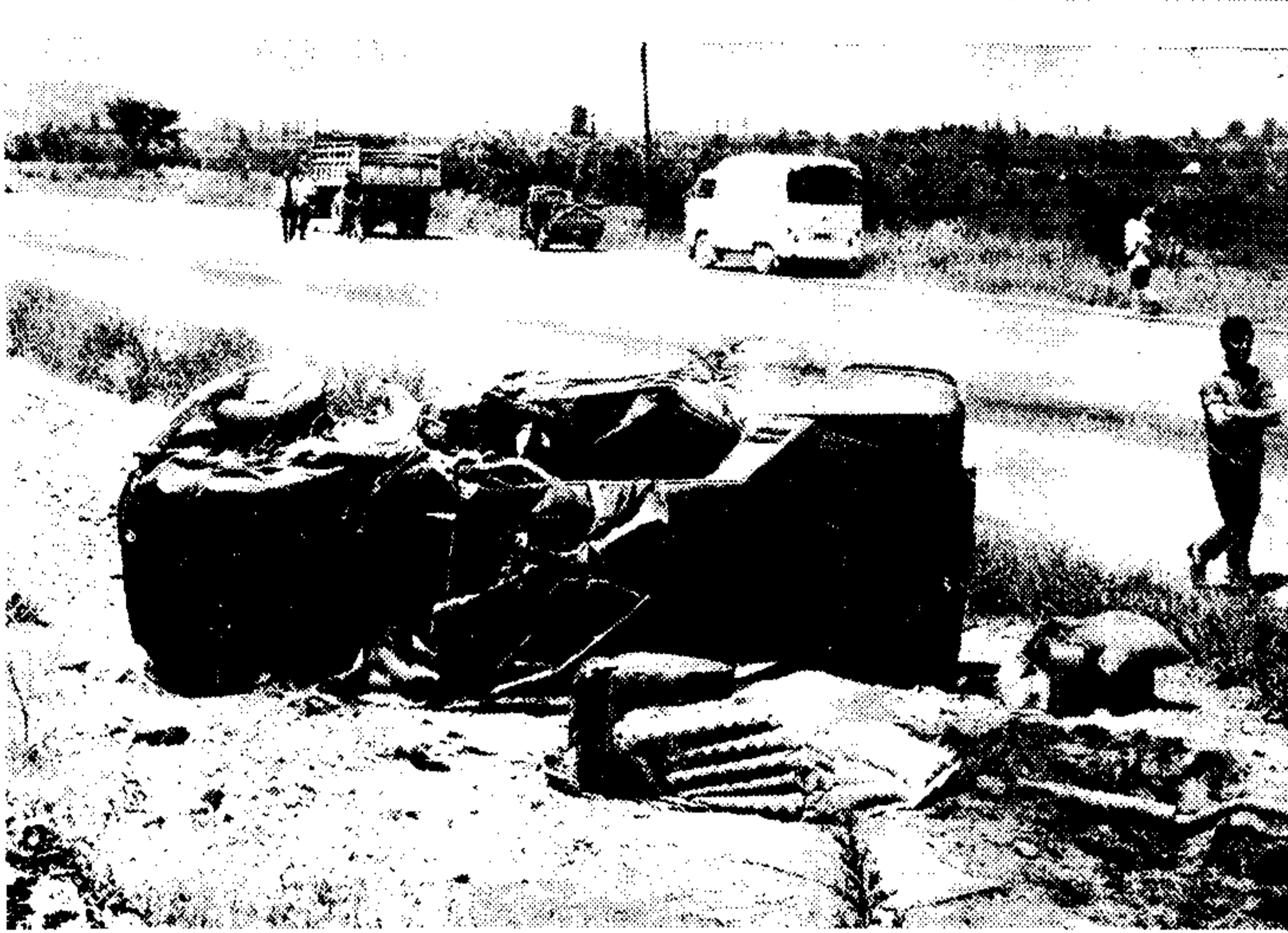
Δύο Γάλλοι, ένας άνδρας και μία γυναίκα, που επέβαιναν αυτοκινήτου με τα χαρακτηριστικά του Διπλωματικού Σώματος...